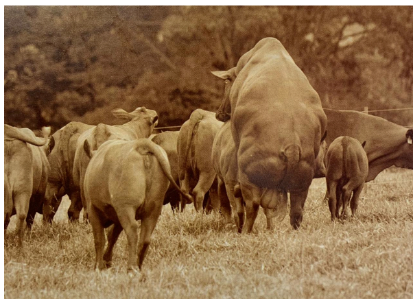
Tomado de Linhagens do Senepol, Os Genearcas Da Raça . Associação Brasileira dos Criadores de Bovinos Senepol.

Con el Programa de Mejoramiento Genético de la raza Senepol - PMGS, la ABCB-Senepol da pasos firmes en la dirección correcta. En menos tiempo que se espera, la compra de un toro dejará de priorizar solo el pedigrí, pues la información disponible se hará más robusta con las DEP's genómicas. Esto acelerará aún más la elección de la mejor genética que se va a multiplicar y mejorar lo que ya es bueno.